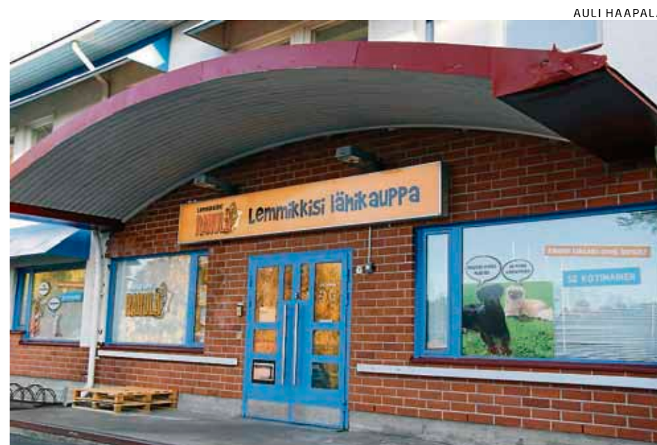
Sopivat liiketilat löytyivät keskustasta Revontieltä.

Yritys toimii itsenäisenä yrityksenä Rahula-nimen alla. Rahula on suomalainen eläintenruokien valmistaja,