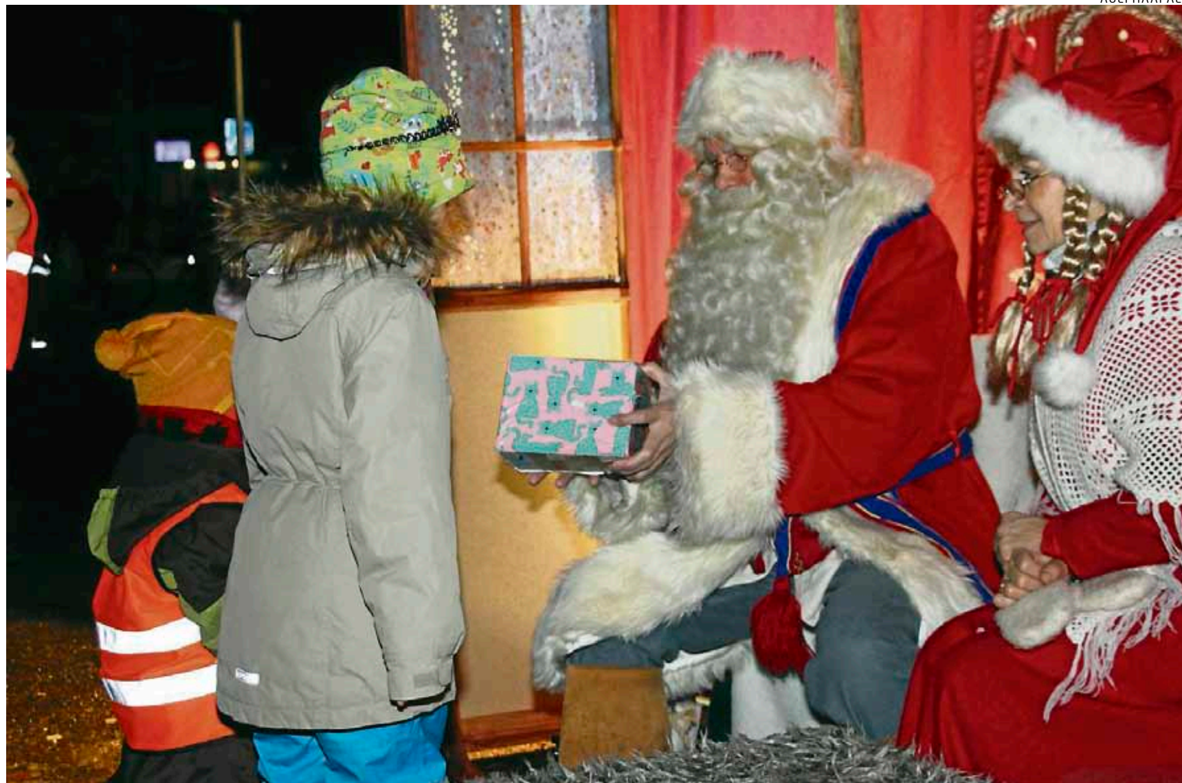
Joulunavauksen odotetuimpia vieraita on joulupukki ja joulumuori, joille voi jättää joululahjatoiveita.