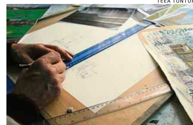
Tarkkaa puuhaa. Lauta kerrallaan Sallan vanha kirkko rakentuu paperille.

kana kymmenen jutun sarjan teemaan liittyen. – Punaisena lankana on ollut, että jokaisen jutun yhteydessä on myös aiheeseen liittyvä akvarelli ja pyrin historiihin lisäksi haastattelemaan aiheeseen liittyvää pai-