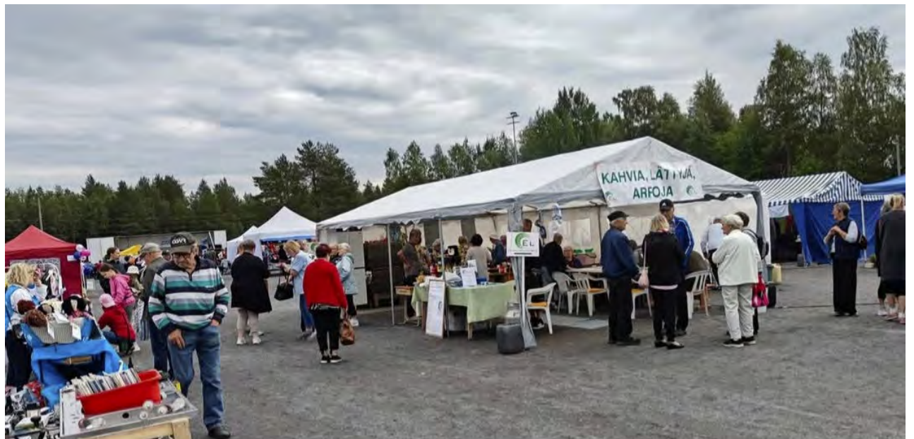
Markkinoille tullaan viihtymään.