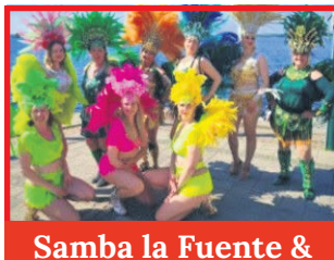
Samba la Fuente & Samba Carisma