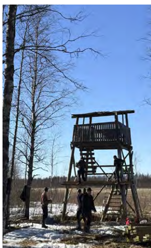
Lintutornin kunnostustalkoot keväällä 2026.

ristöineen on kyläläisten yhteinen kokoontumispaikka. Keväisin salin piha-alueet ja tienvarret siistitään talkoilla. Sali mahdollistaa myös monenlaisia sisäliikuntaa kaikenikäisille. Kunnan hyvinvointipalveluiden Osallistava budjetointi mahdollisti uusien sisä- ja ulkoliikunta välineiden hankin-