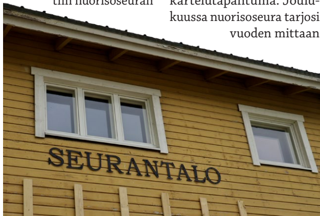
Nuorisoseura sai viime vuonna mittavan Leader-tuen talon kunnostukseen.

Nuorisoseurantaloa, telttakatoksia, kalusteita ja astioita vuokrattiin vuoden mittaan moniin erilaisiin tapahtumiin. Seurantalolla pidettiin nuorisoseuran