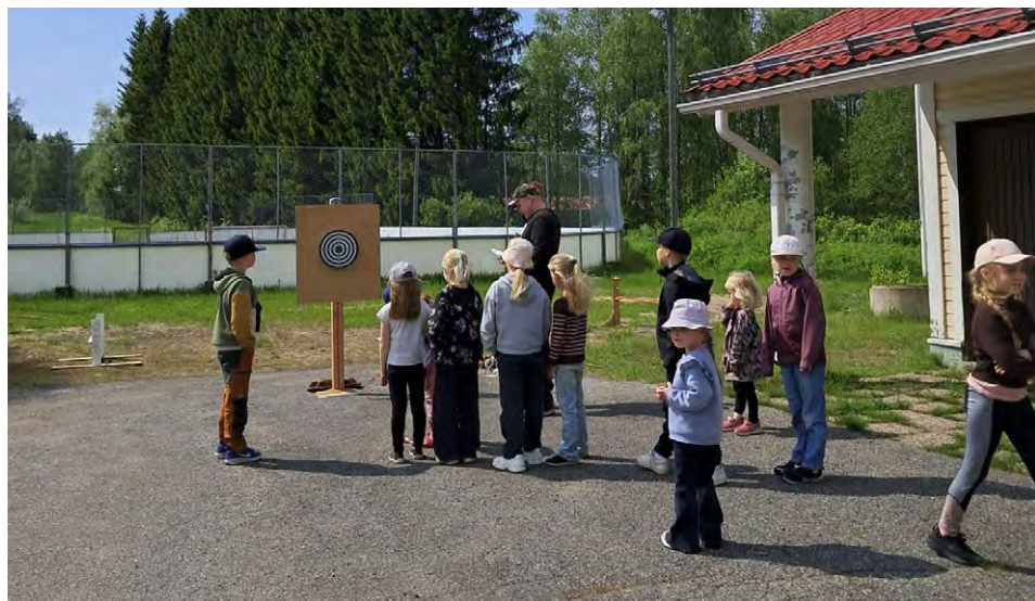
Kyläpäivän tikkakisa 2025.