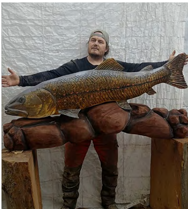
August Eskelisen puuveistokset ovat täynnä tarkkoja yksityiskohtia. Kuvat: August Eskelinen