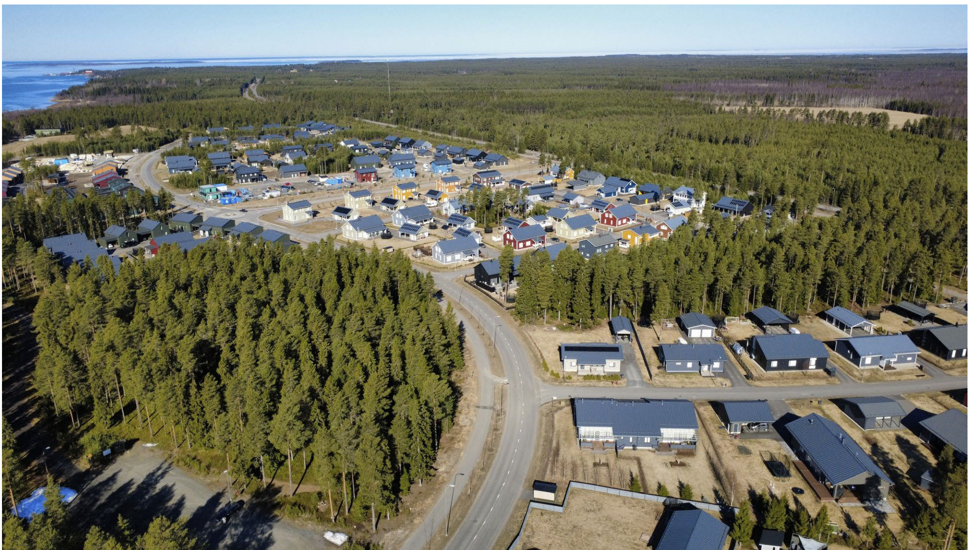
Kellon Letonrannan asuinalue on jo muutamaa tyhjää tonttia vaille täysi.

– Kasvua näkyy erityisesti toimitilarakentamisessa ja pientalorakentamisessa ja pysynyt voimissaan asuntotuotannon valtakunnallisesta romahduksesta huolimatta, Montin totesi.