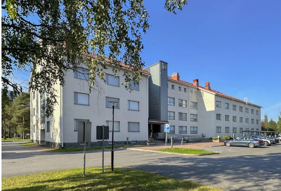
Elinvoimakeskuksen toimitila Oulussa osoitteessa Veteraaninkatu 1.

– Jos kyseessä on päätoiminen yritys, voi tukea hakea myös suoraan elinvoimakeskukselta. Aloitteleville yrityksille Leader on kuitenkin yleensä se luontevampi väylä. Elinvoimakeskuksen investointituet liikkuvat yli 100 000 euron summassa ja Leader-tuet ovat alle 100 000 euroa, Paalanen kertoo.