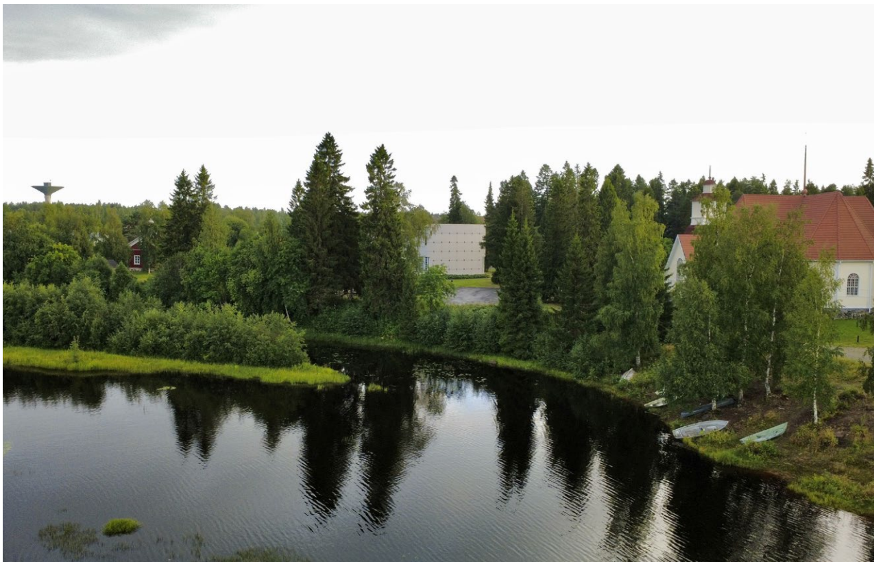
Vierasvenesatama on tarkoitus rakentaa Haukiputaan keskustan kupeeseen.