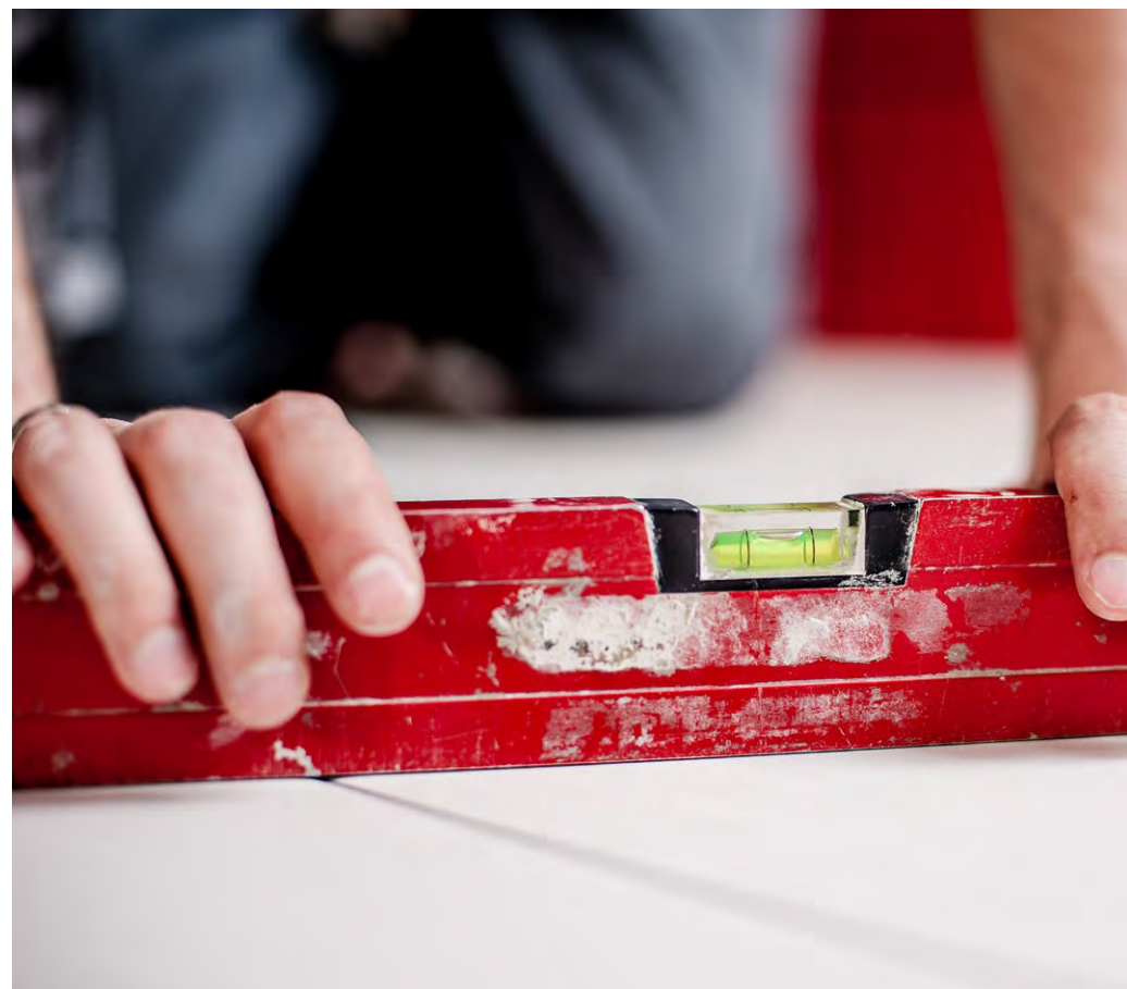
Työnantajat arvostavat nuoren työntekijän aloitteellisuutta.

– Näitä taitoja nuorten kannattaa tuoda esiin esimerkiksi juuri nyt kesätöitä hakiessa, koulutuspoli-