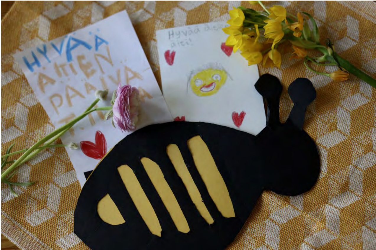
Äitienpäivänä lapset ilahduttavat äitejään itse askartelemillaan korteilla.