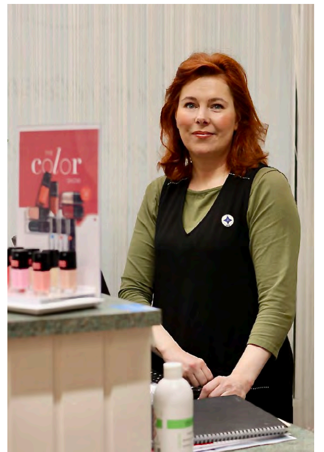
Kaisuleena Joenväärän Kauneus- ja Hyvinvointipalvelut Vanilliini palvelee asiakkaita nykyisin Kiimingin Lasitorilla. Lähtö Jäälästä koitti reilu kuukausi sitten.

– Hanke toteutetaan omalla projektinani, eikä siinä ole tällä hetkellä muita yrittäjiä mukana. Olemme vielä alkuvaiheessa kaavaprosessin osalta, mutta näkymät ovat positiiviset ja uskon hankkeen edistymiseen, Mando kertoo.