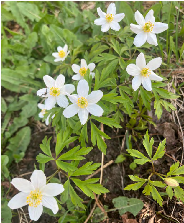
Valkovoikoilla on erityinen paikka monen äitienpäivämuistoissa.

ÄITIENPÄIVÄ on myös tärkeä ajankohta monille suomalaisille yrityksille. Ravintolat, kukkakaupat, kahvilat, leipomot, lahjavarakaupat ja monet muut palvelualan toimijat valmistautuvat juhlapäivään jo viikkoja etukäteen.