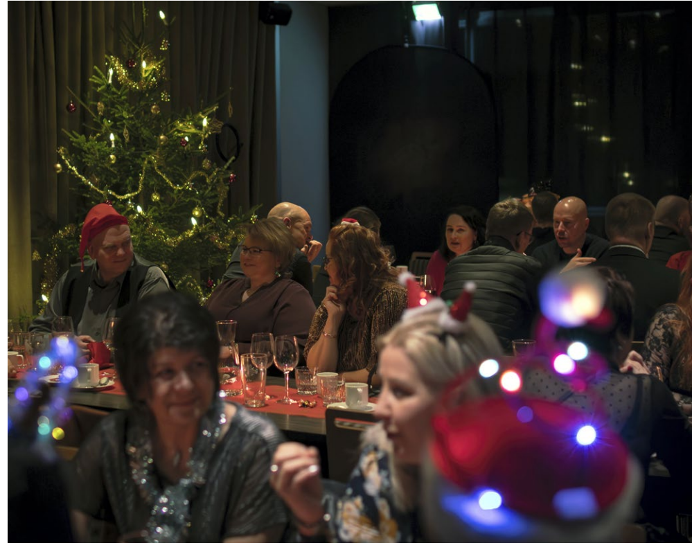
Kiimingin yrittäjien pikkujouluissa Rokualla oli viitisenkymmentä vierasta.

Illalla yrittäjät pääsivät vielä tanssin pyörteisiin, kun hotellin ravintolaan saapui esiintymään Afrikan tähti -tanssiorkesteri solisteineen.