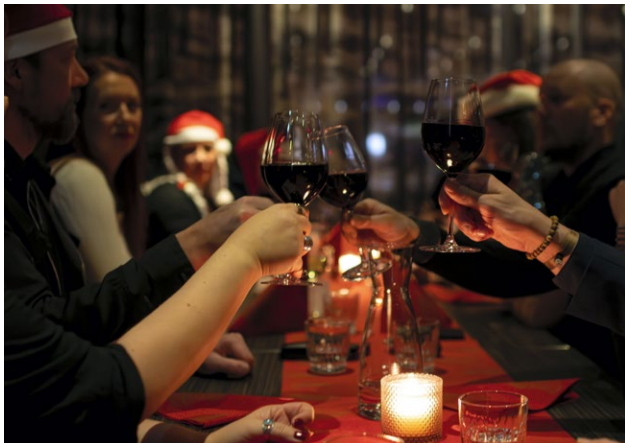
Kippis yrittäjyydelle! Pikujoulupöydässä solmittiin ystävyysuhteita ja vaihdettiin ajatuksia yrittäjyydestä.