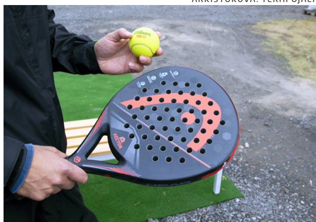
Padel-kurssilla kiiminkiläiset yrittäjät pääsivät harjoittelemaan lajia ammattilaisen ohjein.