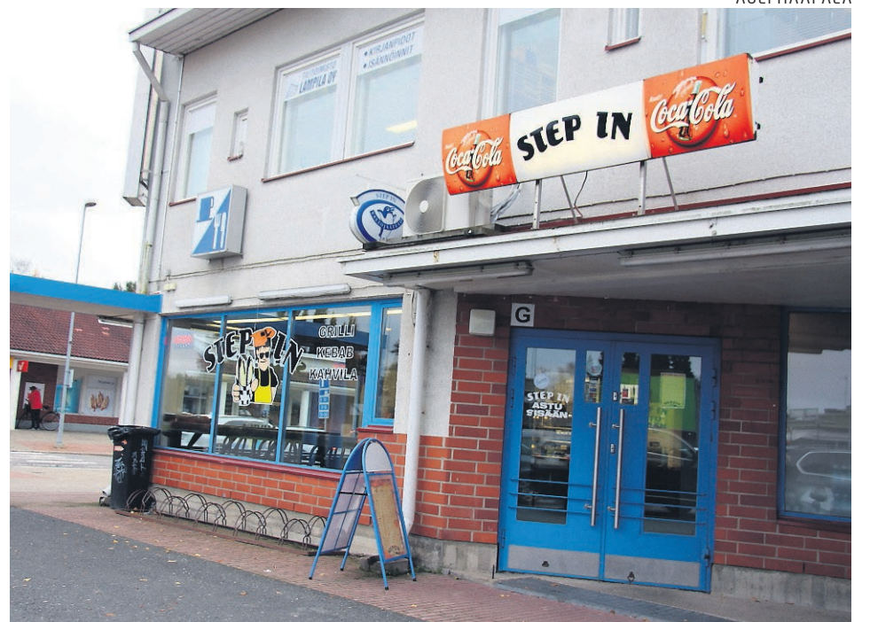
Step In'issä puhaltavat uudet tuulet tutulla paikalla.