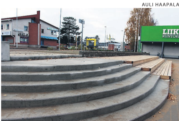
Esiintymislava saatiin Haukiputaan torille, vaikka prosessin aikana se välillä poistettiin suunnitelmista.

Esiin nousivat myös yhteislaulutapahtumat, lavatanssimeininki, kädentaitomessut sekä vaikkapa koiranäyttelyt. Monenlaisten ruokien ympärille toivottiin