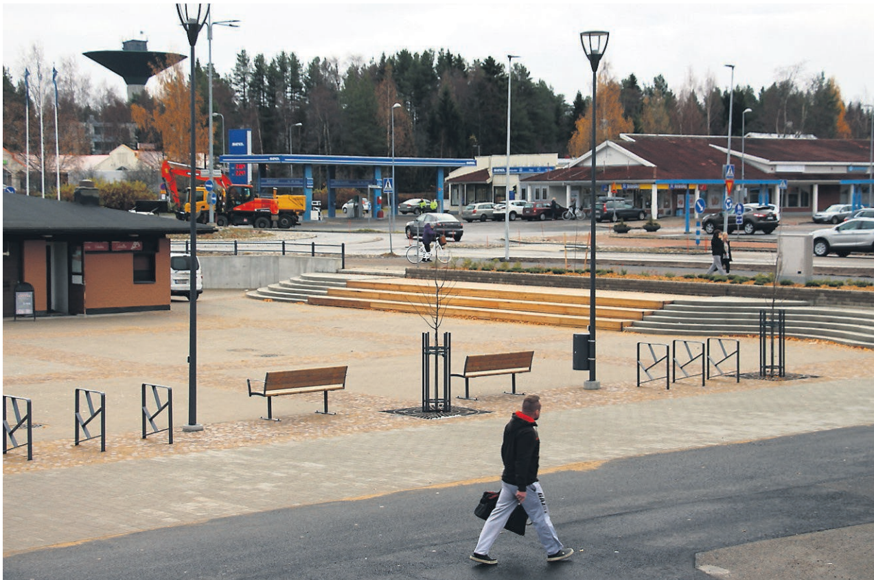
Haukiputaalaiset toivovat torille myyjä ja kivoja yhteistapahtumia. Erityisesti toivottiin joulutoria, vappukarkeloita, kesäisiä toripäiviä ja syysmarkkinoita.