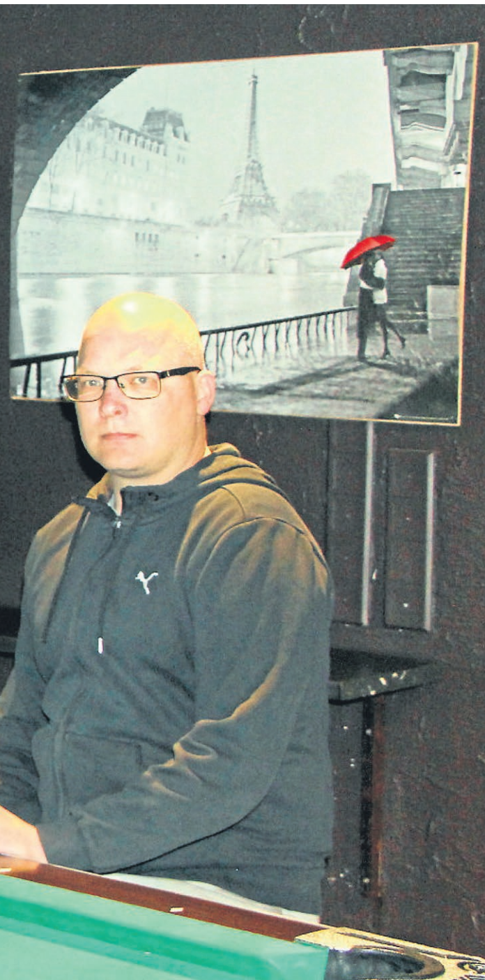
soveltuvan tilan, jota varten ravintolan yhteyteen kunnoste-