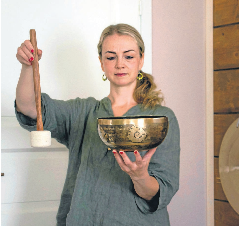
Äänimaljat synnyttävät väreilyä, joka auttaa kehon ja mielen syvärentouttamisessa.