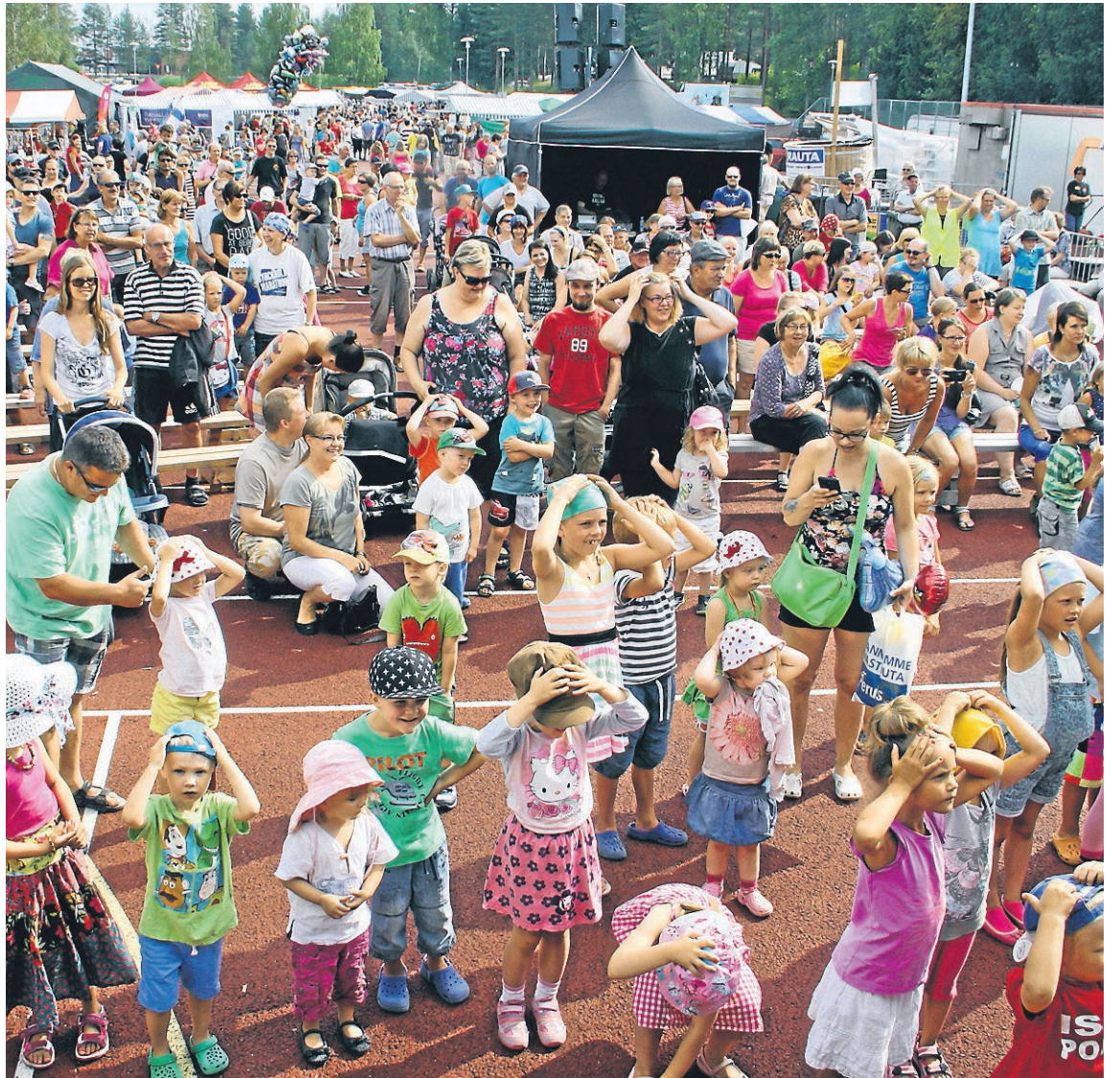
Kiiminkipäivien ohjelmassa on muistettu aina myös lapset.