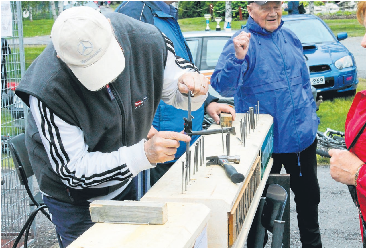
Perinteiset naulanlyöntkilpailut palaavat Kiiminkipäivien ohjelmistoon tänä kesänä.

osioita, joista osa on palannut ohjelmaan muutaman välivuoden jälkeen.