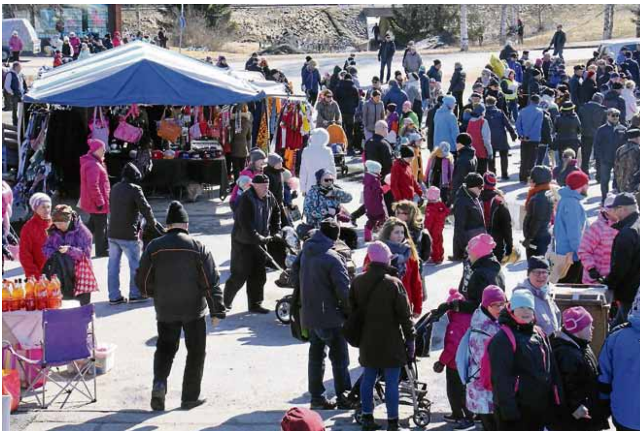
Viime vappuna Haukiputaan yrittäjien järjestämällä vapputorilla kävi noin tuhat henkilöä.

Lisätietoa: http://www.proagriaoulu.fi/fi/yritysgro-2/ ja www.ouluunseudunuusyrityskeskus.fi/