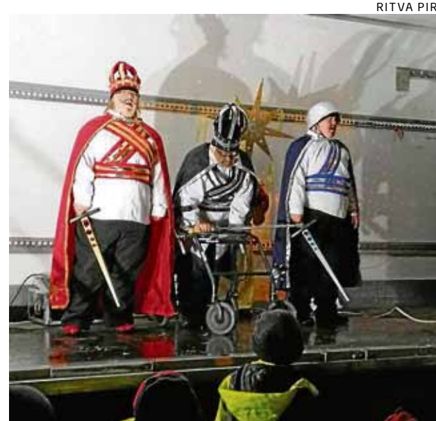
Symppis-kodilta saapuneet tiernapojat olivat Haukiputaan Yrittäjien joulutapahtuman yleisömagneetti.