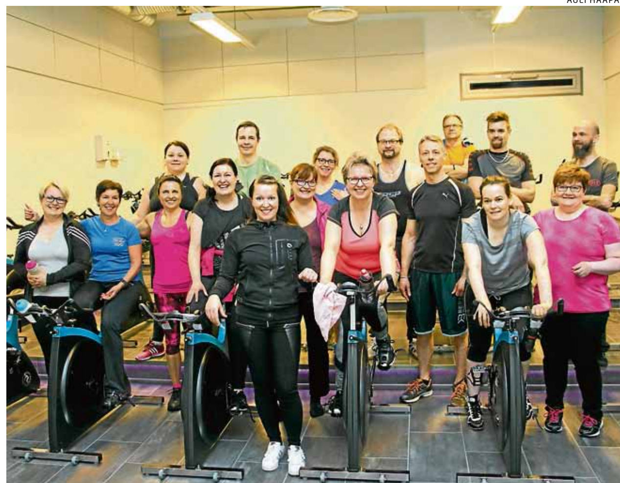
Joukko haukiputaalaisia yrittäjiä osallistui viime vuonna yrittäjähdistyksen järjestämään kuntoiluprojektiin.

– Sen avulla voidaan samanaikaisesti purkaa turhia esteitä tai pelkoja yrittäjyydestä ja luoda realistista kuvaa yrittäjyyden vaatimuksista. Lisäksi yritystoiminnan alussa erilaiselle tiedolle ja tuelle on suuri tarve. Eräs hyväksytty havaittu tapa auttaa yrittäjyysalussa olevia on vertaistu-